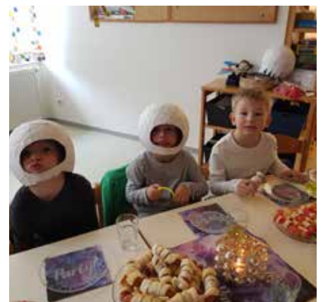
Bilder und Text: Monika Klinser