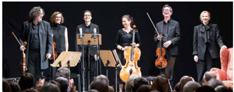
Die KULTINI Hinterstoder freut sich auf ihren Besuch.